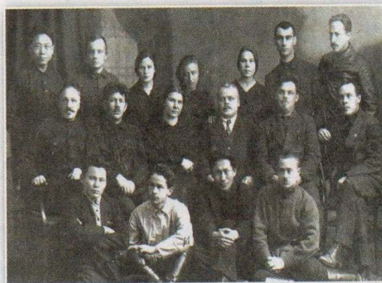
Участники установления Советской власти в Якутии. 1918

Вклад Степана Васильевича в развитии золотодобывающей промышленности в Якутии неоценим. Так, в апреле 1926 г. по предложению председателя Совнаркома ЯАССР М.К. Аммосова был направлен в длительную командировку в Алдан для подготовки материалов по организации треста золотодобывающей промышленности. Это был период становления первого промышленного предприятия Якутии по добыче золота.