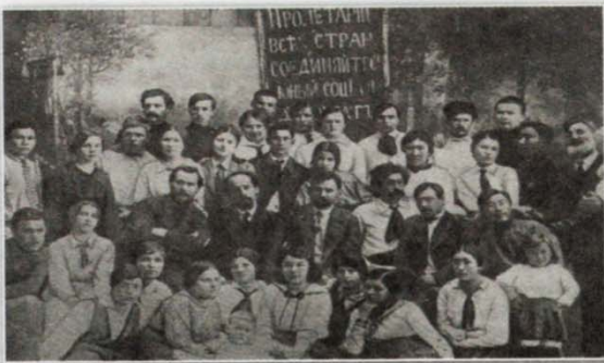
Члены кружка «Юный социал-демократ»

Разрабатывал вопросы государственности и получения статуса автономной республики. Платон Алексеевич Ойунский был автором первых правовых документов будущей республики — земельного, Декларации трудящихся, Конституции.