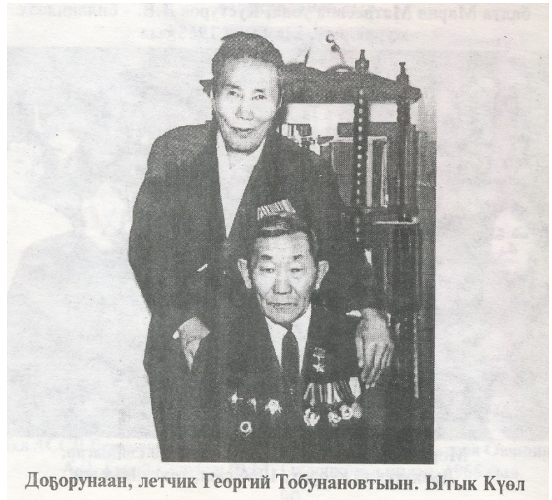
Доѳорунаан, летчик Георгий Тобунановтын. Ытык Күөл