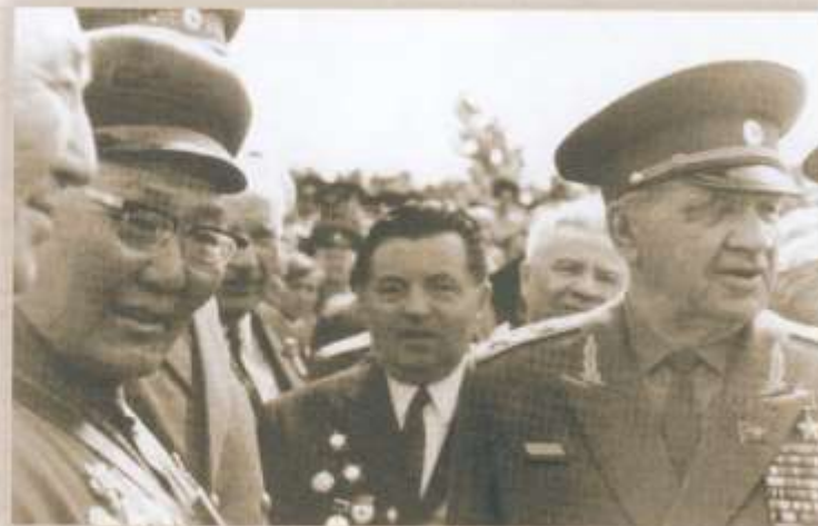
С Маршалом Советского Союза В.И. Чуйковым