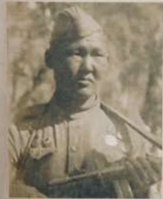
Прославленный артиллерист Г.Д. Протодьяконов

В ожесточенной схватке на Мамаевом кургане Г.Д. Протодьяконов, оставшись один, раненый и контуженный, уничтожил 3 «тигра» и отбил две атаки пехоты противника.