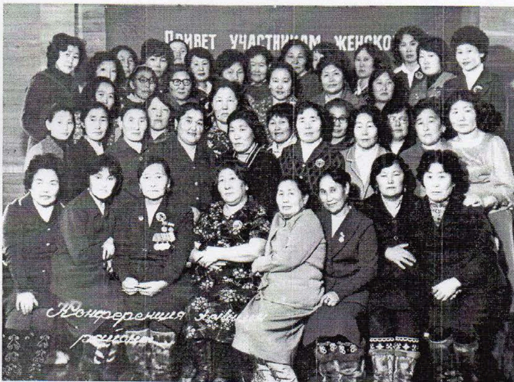
Конференция женщин 1974г.