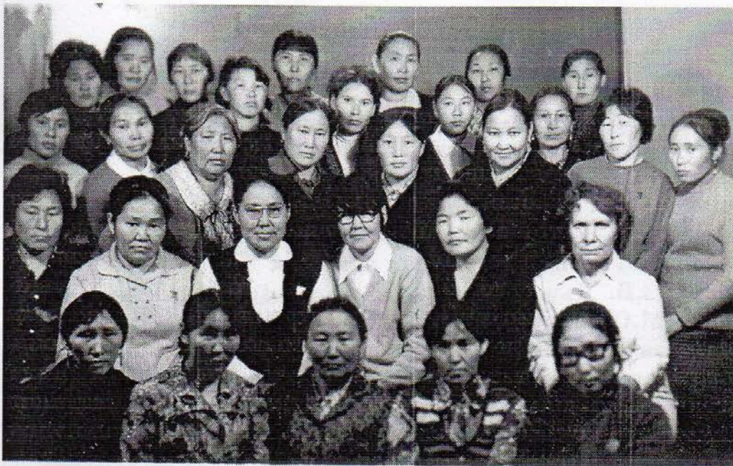
Республиканский зональный семинар библиотекарей 1974г. с. Утмы-Талы